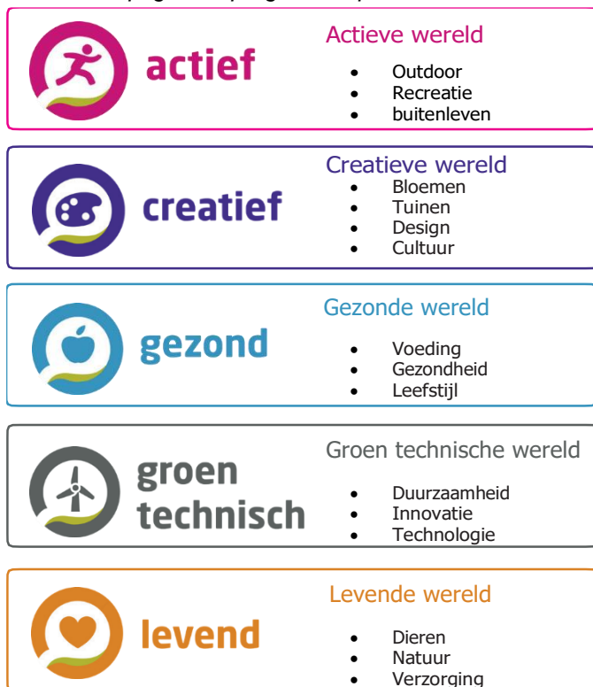
Figuur 4 Vijf werelden in de bovenbouw van het vmbo

Op 1 augustus 2021 is Zone.college Zwolle in de bovenbouw (leerjaar 3 en 4) van het vmbo gestart met zogeheten werelden . We spreken niet meer over aparte vakken, maar de leerlingen werken in een van deze vijf werelden: Actief, Creatief, Gezond, Groen technisch of Levend. In deze werelden werken we in thema's die worden afgesloten met een integrale opdracht. Dit is een beroepsgerichte praktijkopdracht, waarin de leerling laat zien wat hij of zij de afgelopen negen weken heeft geleerd. In een wereld wordt bewust gewerkt aan een aantal vaardigheden om de leerling voor te bereiden op de toekomst. In de wereld van profiel Groen is er aandacht voor de 21e-eeuwse vaardigheden, ondernemerschap, duurzaamheid, technologie, eigen initiatief en keuzemogelijkheden.